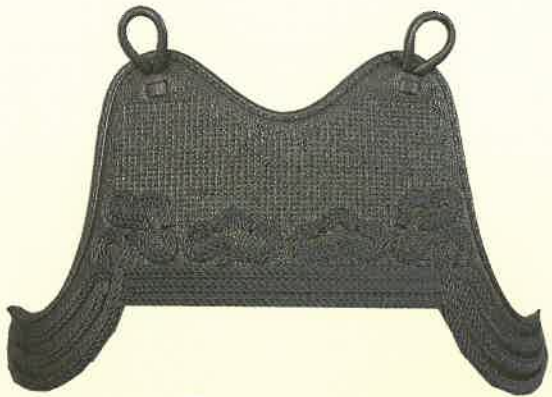
① 刺 胸