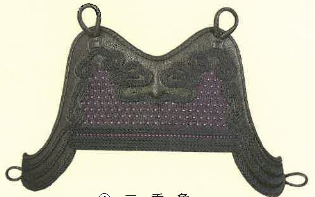
④ 二重 亀